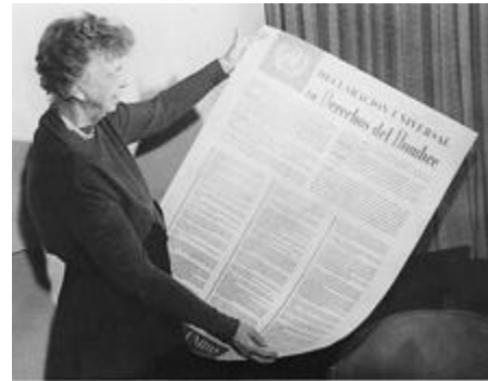
Roosevelt mit der spanischen Sprachversion der AEMR

Eleanor Roosevelt war von März 1933 bis April 1945 First Lady der Vereinigten Staaten. Im Dez. 45 wurde sie als US – Delegierte in die UN berufen und leitete dort die Menschenrechtskommission. „Sie gilt neben Hillary Clinton als eine der einflussreichsten Frauen in der US-amerikanischen Politik des 20. Jahrhunderts“(1).